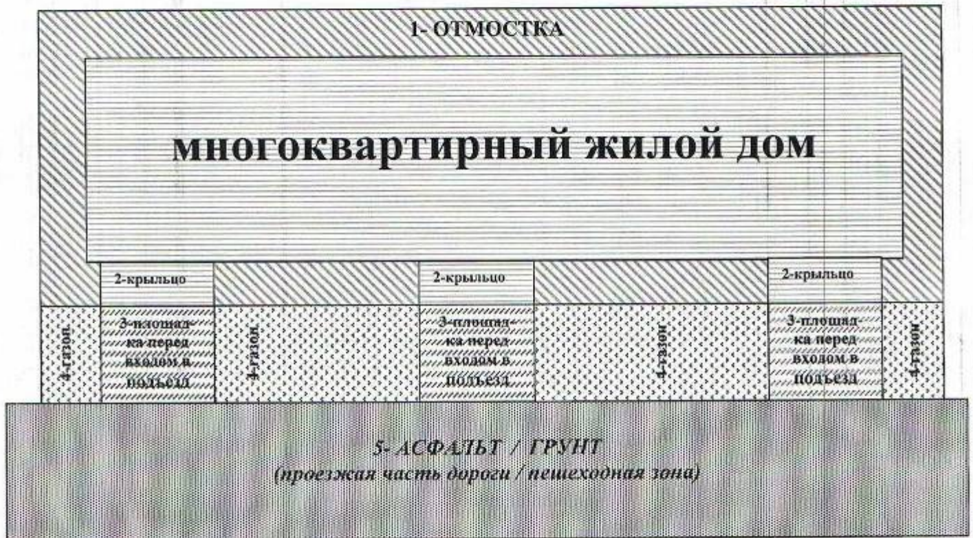
Рисунок 1*: План-схема придомовой территории МКД, убираемой в пределах тарифа, перечня и периодичности выполнения работ по содержанию земельного участка, установленных Приложением № 1 к настоящему Договору.

К придомовой территории многоквартирного дома, убираемой управляющей организацией относится: