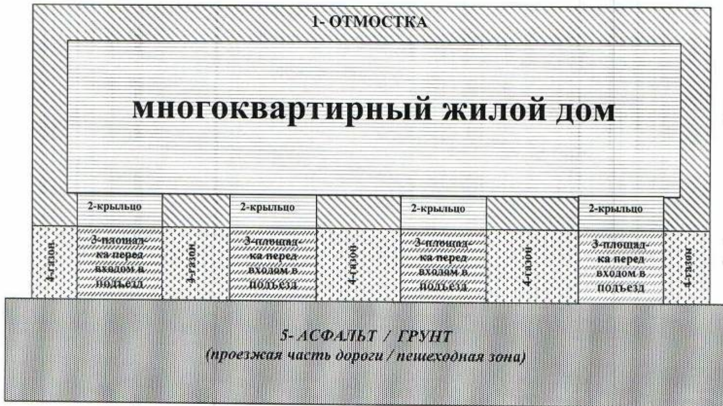
Рисунок 1*: План-схема придомовой территории МКД, убираемой в пределах тарифа, перечня и периодичности выполнения работ по содержанию земельного участка, установленных Приложением № 1 к настоящему Договору.

К придомовой территории многоквартирного дома, убираемой управляющей организацией относится: