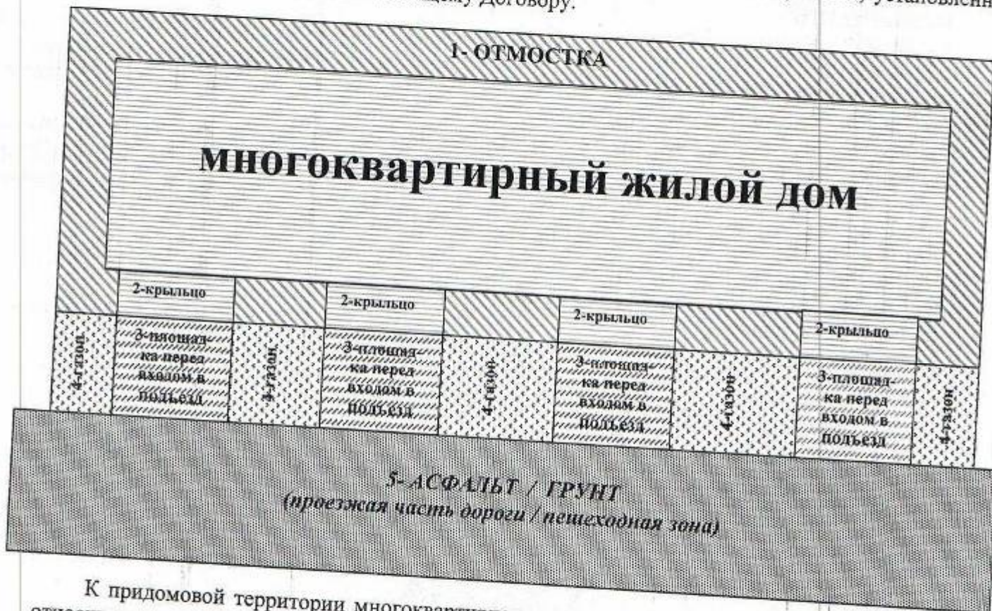
Рисунок 1*: План-схема придомовой территории МКД, убираемой в пределах тарифа, перечня и периодичности выполнения работ по содержанию земельного участка, установленных Приложением № 1 к настоящему Договору.

К придомовой территории многоквартирного дома, убираемой управляющей организацией относятся: